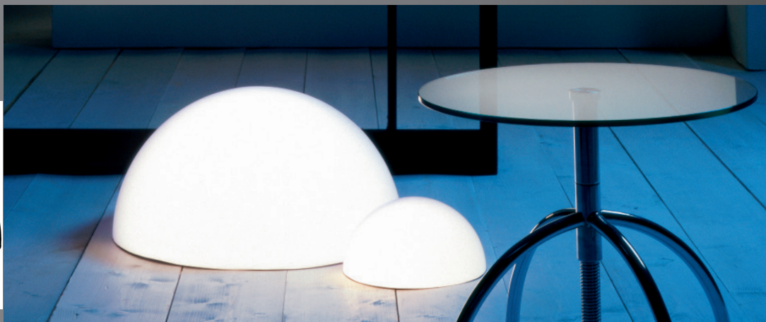
BHMFL - Akkuleuchte Größen: 350 - 750mm